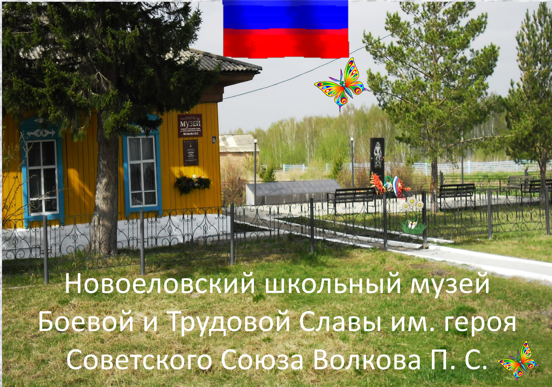
Новоеловский школьный музей Боевой и Трудовой Славы им. героя Советского Союза Волкова П. С.